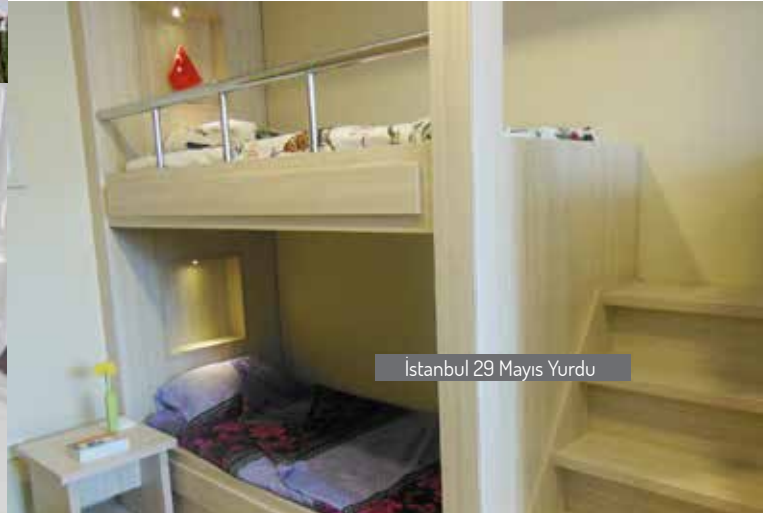
İstanbul 29 Mayıs Yurdu

ÜİP öğrencileri program kapsamında kendileri için sağlanan yurtlarda ücretsiz olarak konaklayabilmektedir. Öğrenciler fakültelere yakınlık, ulaşım ve diğer fiziki imkânlar düşünülerek huzurlu, rahat bir barınma ve çalışma ortamı olan, uygun ve nezih mekânlarda barındırılmaya çalışılmaktadır. Bu amaçla TDV, öğrenci yurtlarını öğrencilerimizin istifadesine sunmaktadır. TDV yurtları olmayan yerlerde ise anlaşmalı yurtlardan hizmet satın alımı yoluyla öğrencilerimizin barınma ihtiyacı karşılanmaktadır. Öğrencilerin eğitimleri boyunca bir fiziki bütünlük oluşturma, takviye ders ve kurslar planlama, yapılacak sosyal ve kültürel etkinlikleri takip etmeleri gibi konular göz önünde bulundurularak Kurumumuzca gösterilen yurtlarda kalmaları istenmektedir.