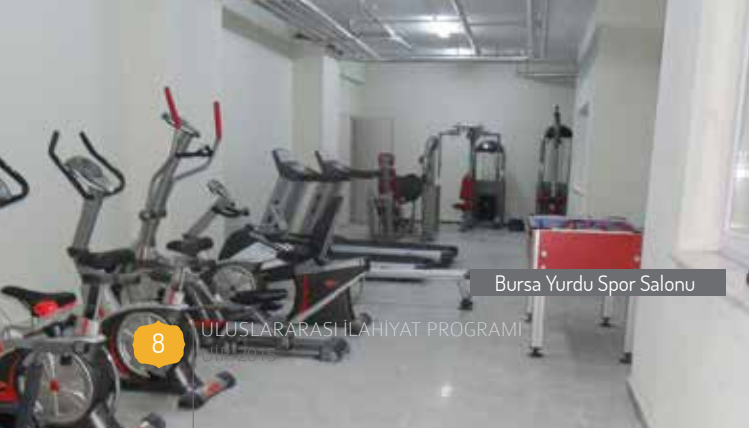
Bursa Yurdu Spor Salonu