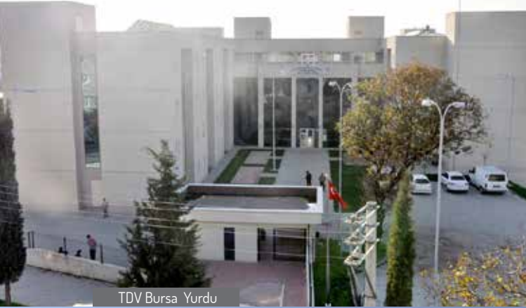
TDV Bursa Yurdu