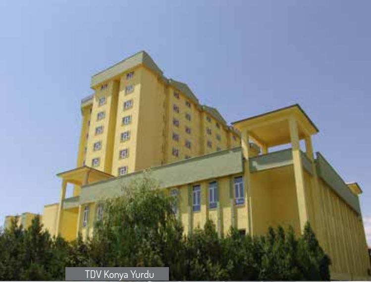
TDV Konya Yurdu